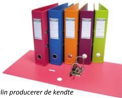
Hamelin producerer de kendte Bantexmapper til bla. Dansk Supermarked og Metro

”Jeg må indrømme, at vi havde vores tvivl om et lille firma som Logidan kunne løfte opgaven, men det skal jeg love for, at de kunne!